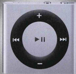
iPod shuffle Der elegante, robuste neue iPod shuffle lässt sich überall anklipsen und hunderte Songs überallhin mitnehmen