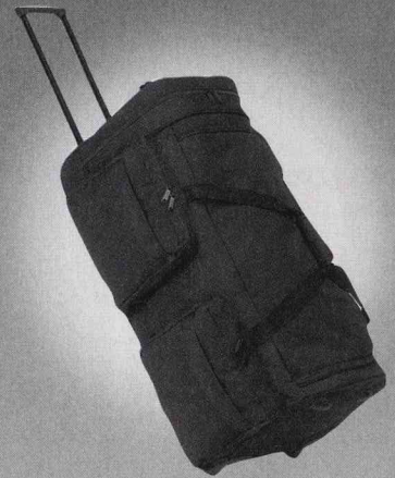
Trolley-Reisetasche Ein komfortabler Trolley mit großem Hauptfach und vier weiteren nützlichen Taschen.